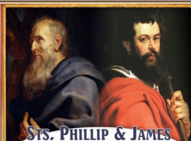
ST. PHILLIP & JAMES